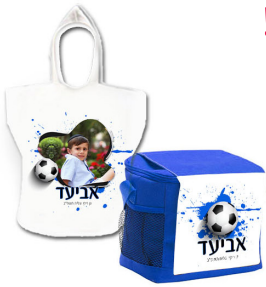
צידינית + חלוק מגבת - 76 ש"ח