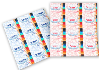
דף מדבקות - 12 ש"ח