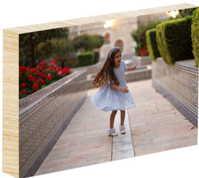
בלוק עץ A4 - 45 ש"ח