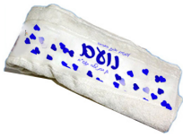
מגבת נט"י (5*50) - 18 ש"ח