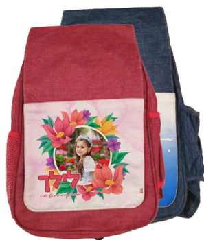
תיק גן - 34 ש"ח בצבעים שונים