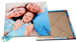
משחק טנגרם מעץ - 39 ש"ח