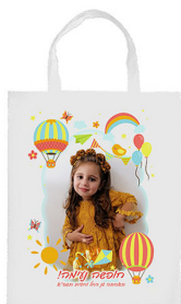
תיק ידית - 18 ש"ח