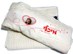
מגבת גוף (70*130) - 45 ש"ח

קיים במגוון צבעים הדפסה על אלומיניום - לא מדבקה