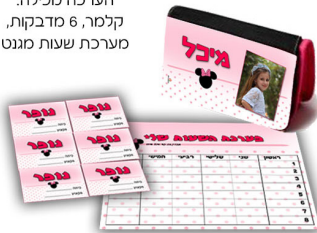
ערכה לכיתה א' - 45 ש"ח

הערכה מכילה: קלמר, 6 מדבקות, מערכת שעות מגנט