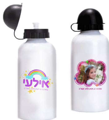
בקבוק ילדים - 27 ש"ח