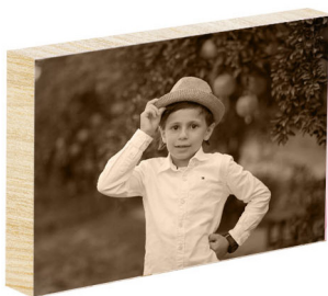
בלוק עץ A5 - 20 ש"ח