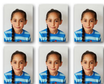
פספורט (36 יח') - 30 ש"ח