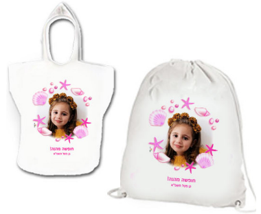
תיק שרוך + חלוק מגבת - 59 ש"ח