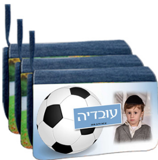
קלמר (3 תאים) - 24 ש"ח