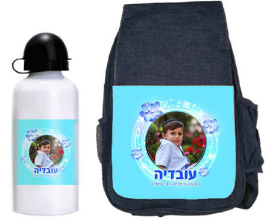
תיק גן + בקבוק - 62 ש"ח