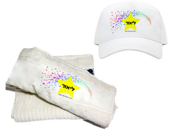
כובע + מגבת רחצה - 47 ש"ח