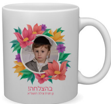
ספל - 16 ש"ח