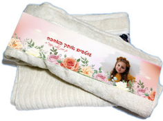
מגבת גוף ילד (50*90) - 36 ש"ח