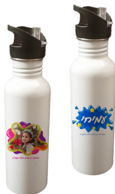
בקבוק תרמי עם קש - 33 ש"ח