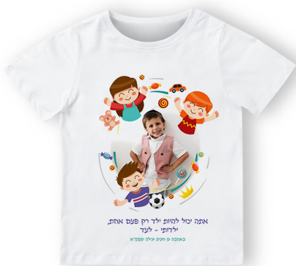
חולצה הדפסה צבעונית - 19 ש"ח