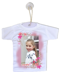
מיני חולצה לרכב - 16 ש"ח