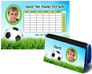
קלמר + מערכת שעות - 35 ש"ח A4 מגנט