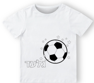
חולצה לצביעה - 18 ש"ח