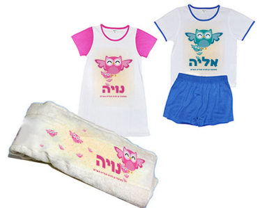
פיג'מה + מגבת גוף - 72 ש"ח