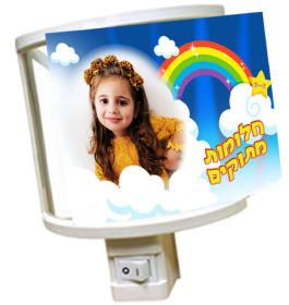
מנורת לילה - 29 ש"ח עם תו תקן