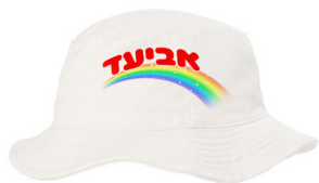
כובע טמבל - 16 ש"ח