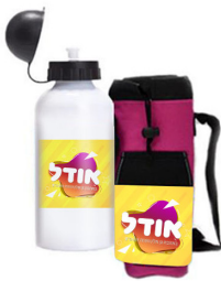
בקבוק + מידנית - 50 ש"ח