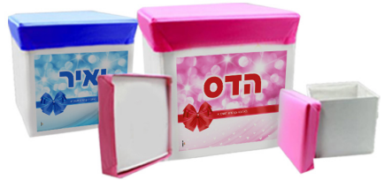
כסא קופסא - 36 ש"ח