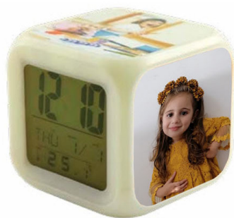
שעון מעורר - 45 ש"ח