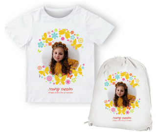
חולצה + תיק שרוך - 34 ש"ח הדפסה צבעונית