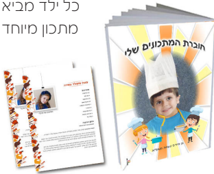
חוברת מתכונים A5 - 24 ש"ח