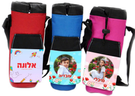
מידנית - 24 ש"ח