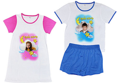
פיג'מה - 39 ש"ח