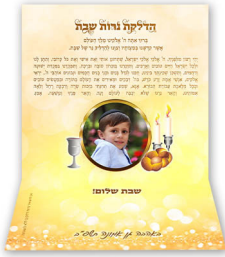
מעמד לנרות שבת - 18 ש"ח