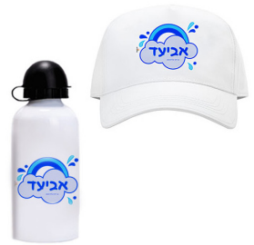
כובע + בקבוק - 39 ש"ח