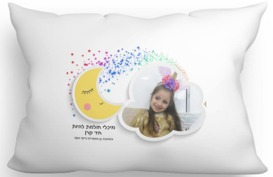
כרית + מילוי - 33 ש"ח גודל ההדפסה 30*20