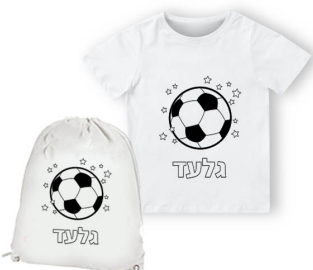
חולצה + תיק שרוך - 34 ש"ח הדפסה שחור לבן