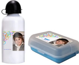
קופסת אוכל + בקבוק - 55 ש"ח