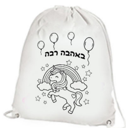
תיק שרוך לצביעה - 18 ש"ח