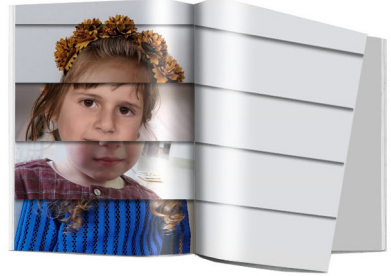
חוברת פרצופים A4 - 48 ש"ח