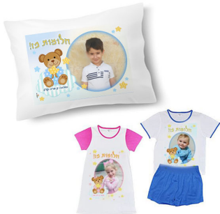
פיג'מה + כרית - 69 ש"ח