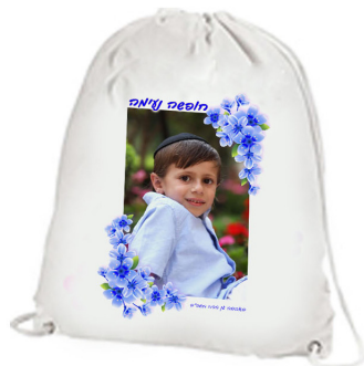
תיק גב שרוכים - 18 ש"ח