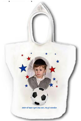
חלוק מגבת - 45 ש"ח