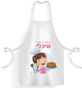
סינר ילד - 18 ש"ח