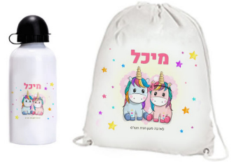
תיק שרון + בקבוק - 43 ש"ח

הערכה מכילה: קלמר, 6 מדבקות, מערכת שעות מגנט