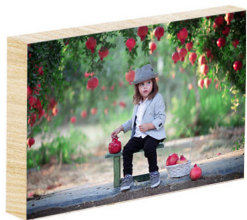
בלוק עץ 10*15 - 16 ש"ח