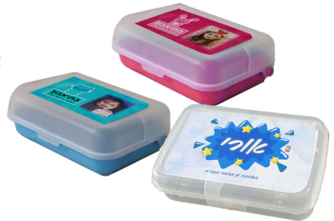
קופסת אוכל - 29 ש"ח

קיים במגוון צבעים הדפסה על אלומיניום - לא מדבקה