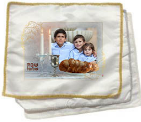
כיסוי לחלות - 20 ש"ח