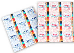
דף 12 מדבקות - 12 ש"ח