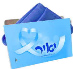
מעמד למפיות/ברהמ"ז - 14 ש"ח