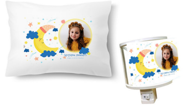
כרית + מנורת לילה - 58 ש"ח