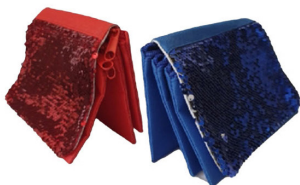
קלמר פייאטים - 28 ש"ח הדפסת שם בלבד