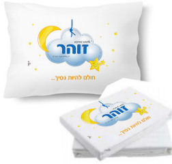
כרית + ציפה + סדין - 59 ש"ח