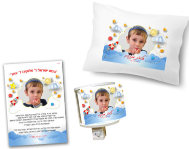
מנורת לילה + ק"ש - 69 ש"ח