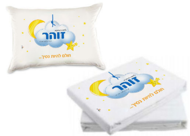
סדין+כרית+ציפית - 59 ש"ח