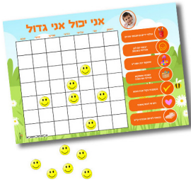
מגנט לעידוד הילד - 15 ש"ח