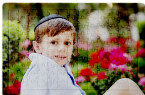
פאזל 36 חלקים - 29 ש"ח