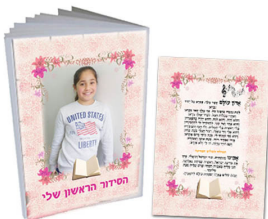
חברת סידור A5 - 24 ש"ח כרומו 170 גרם