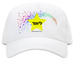
כובע הדפסה צבעונית - 13 ש"ח