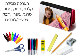
ערכה לכיתה א' - 45 ש"ח

הערכה מכילה: קלמר, מחק, מחדד, סרגל, עיפרון, דבק, צבעים/לורדים